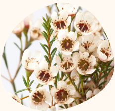
Flor de cera