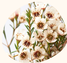
Flor de cera