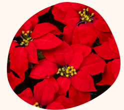
Flor de Pascua